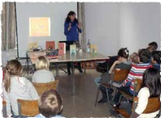
Bibliotheek 👉 gedichtendag